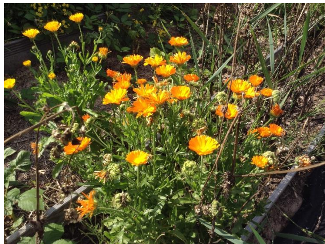
Abbildung 2 (rechts). Zuhause (Titel und Foto der Studentin)