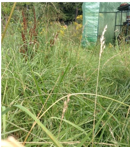
Abbildung 1 (links). Gefahr der Natur gegenüber dem Menschen (Titel und Foto der Studentin)

Studentin (PHL): Also eine Feuerstelle natürlich auch [lacht]. Ja, wir haben selbst so eine Feuerschale